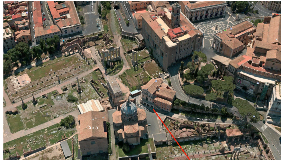
❖ Forum Romanum - Teilsicht mit Curia, Capitolsplatz und Mamertinum

Kein Jubel. Keine Buhrufe. Cicero stieg von der Rostra und machte sich auf den Weg zum Palatin, während die Menge sich in Richtung Esquilinus, Subura und Viminalis zerstreute. Vor dem kleinen, runden Vestatempel begegnete ihm eine größere Gruppe von Rittern der Achtzehn, angeführt von Atticus. Die Männer hatten ihre Fackeln bereits entzündet, denn die Dunkelheit brach herein, und sie feierten ihn als den Retter des Vaterlandes, als pater patriae , als einen mythischen Helden. Welch ein Balsam für seine Seele! Die Verschwörung des Lucius Sergius Catilina war zerschlagen; er allein hatte sie aufgedeckt und im Keim erstickt.