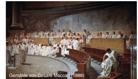
Gemälde von Cesare Maccari (1888)

Nenne stichwortartig die Fakten, die Cicero in diesem Kapitel nennt bzw. die sich aus seinen Worten ergeben!