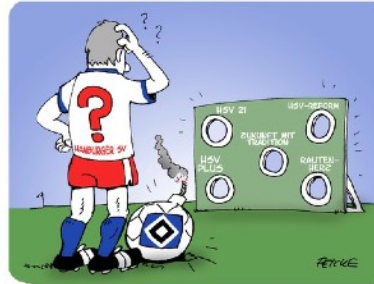
QUO VADIS, HSV?