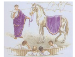
aus: Taschen-Brockhaus Altes Rom