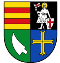
Wappen der Stadt Damme mit dem Hl. Viktor

victor oris m. · _____ · vgl.: vincere (siegen), victoria (Sieg) · vgl. Engl.: victory (Sieg), victor (Sieger)