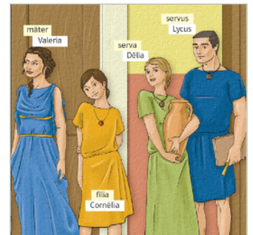
aus: Pontes, S. 14