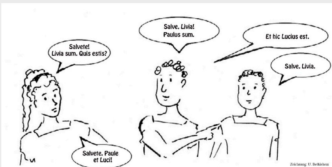
Zeichnung: U. Bethlehen

Ausnahme 1: Bei Substantiven der ____-Dekl. auf -us endet der Vokativ im Sg. auf -_____.