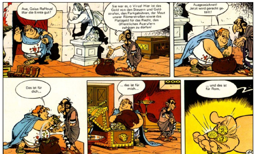
aus: Asterix und die Schweizer