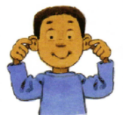
aurēs (f pl) aus: First 1000 Words in Latin