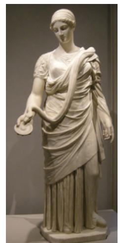
Göttin Salus (griech.: Hygieia)