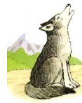
aus: First 1000 Words in Latin