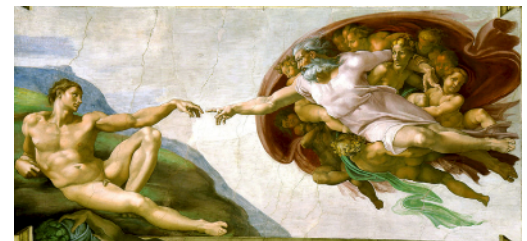
Michelangelo - Die Erschaffung Adams (zw. 1508 und 1512)