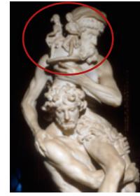
Aeneas trägt seinen Vater Anchises aus dem brennenden Troja; dieser hält in der Hand die Penaten (Statue von G. Bernini)