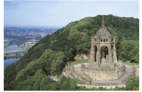
Kaiser-Wilhelm-Denkmal an der Porta Westfalica (minder-erleben.de)