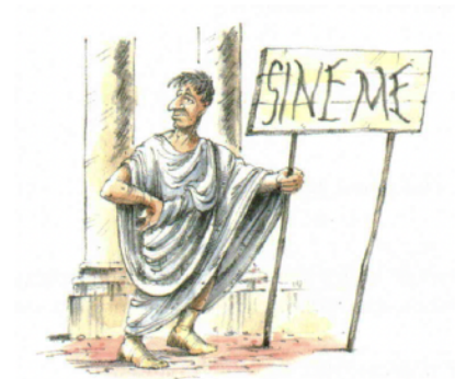
aus: Lehrbuch Cursus Continuus