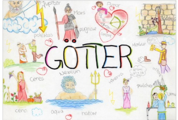
© Birte Bollhorst und Mareike Schneekönig