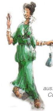
aus: Lehrbuch Cursus Continuuus