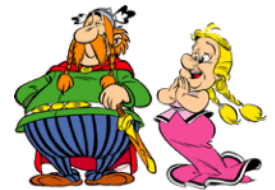
maritus Majestix uxor Gutemine