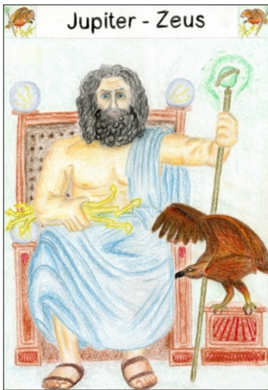
Jupiter - Zeus