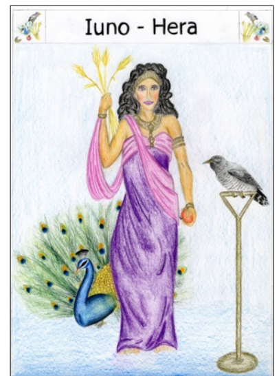
Iuno - Hera