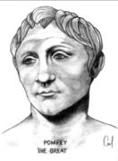
POMPEY THE GREAT