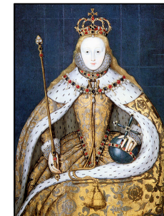
Elizabeth I. Tudor (1533-1603)