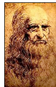
Leonardo da Vinci (1452-1519)