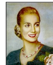
Evita Peron (1919-1952)