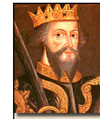
William the Conqueror (1027-1087)