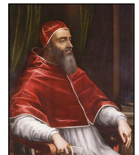
Giulio de Medici (1478-1534), Papst Clemens VII.