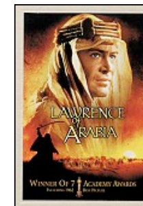
Lawrence of Arabia (1888-1935)